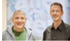
Das Team der Werkstatt Bibel freut sich auf Ihren Besuch.

Die Werkstatt Bibel ist eine Einrichtung des Amtes für missionarische Dienste der Evangelischen Kirche von Westfalen in Verbindung mit der von Cansteinschen Bibelanstalt in Westfalen e.V.