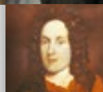
Carl Hildebrand Freiherr von Canstein gründete 1710 die älteste Bibelanstalt der Welt und sorgte dafür, dass die Bibel für viele Menschen bezahlbar wurde.