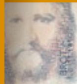
Im Zentrum der Bibel steht die Geschichte Gottes mit den Menschen. Entdecken Sie, wie mit Gottes Offenbarung in Jesus Christus die Geschichte der Christen und der Kirche beginnt.